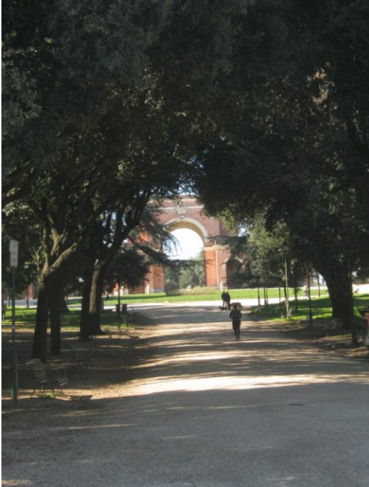
Sui ruderi di Villa Corsini l'Arco dei Quattro Venti - oggi (arch. Busiri Vici, 1859)

IL 3 GIUGNO 2014 : APPUNTAMENTO - ORE 18