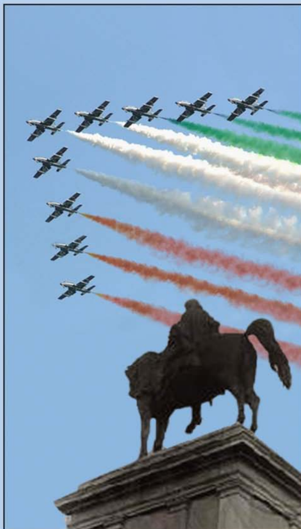
4 luglio 2007 Celebrazione del Bicentenario della nascita di Giuseppe Garibaldi Le Freccie Tricolori sorvolano il Gianicolo

1807 - 2007 GARIBALDI BILANCIO DEL BICENTENARIO