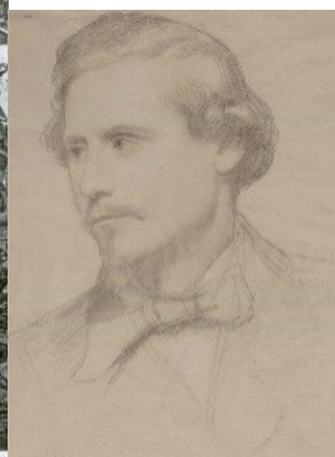
Goffredo Mameli ritratto dal vero (1849)