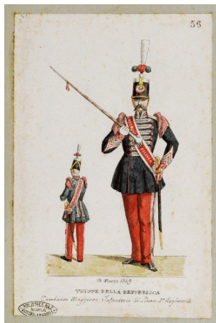
Raccolta Piroli – Tamburo maggiore