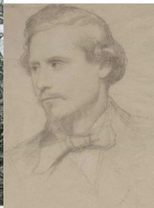
Goffredo Mameli ritratto dal vero (1849)