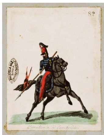
Raccolta Piroli – Lancieri Masini

A VILLA PAMPHILI “PER NON DIMENTICARE” IL 3 GIUGNO 1849 proprio sui luoghi dei combattimenti per la difesa di Roma e della Repubblica Romana del 1849 Con il patrocinio del Municipio Roma XII