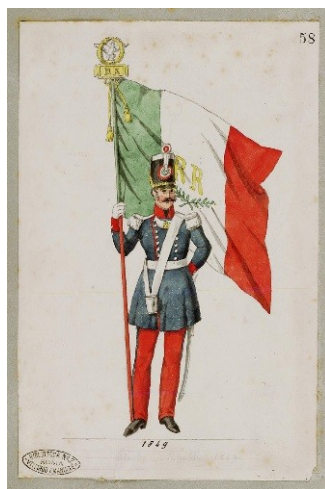
Raccolta Piroli – Ufficiale portabandiera