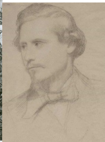
Goffredo Mameli ritratto dal vero (1849)